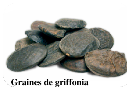
Graines de griffonia

Les graines de griffonia , plante d'origine africaine, contiennent à l'état naturel environ 10% de 5-htp. On peut donc la consommer en graine ou, plus pratique, en poudre (gélule) pour traiter l'insomnie et la déprime.